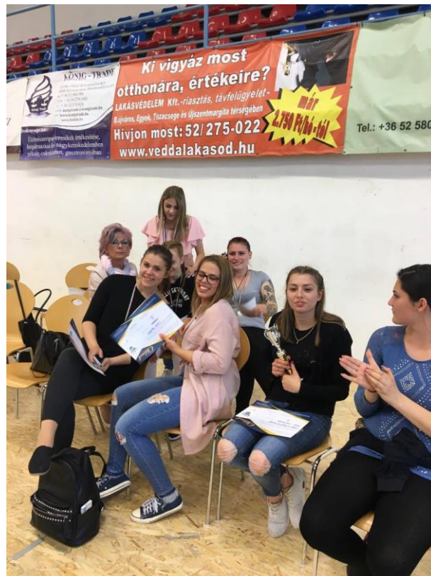
Balmazújvárosi Hajkarnevál 2017. május