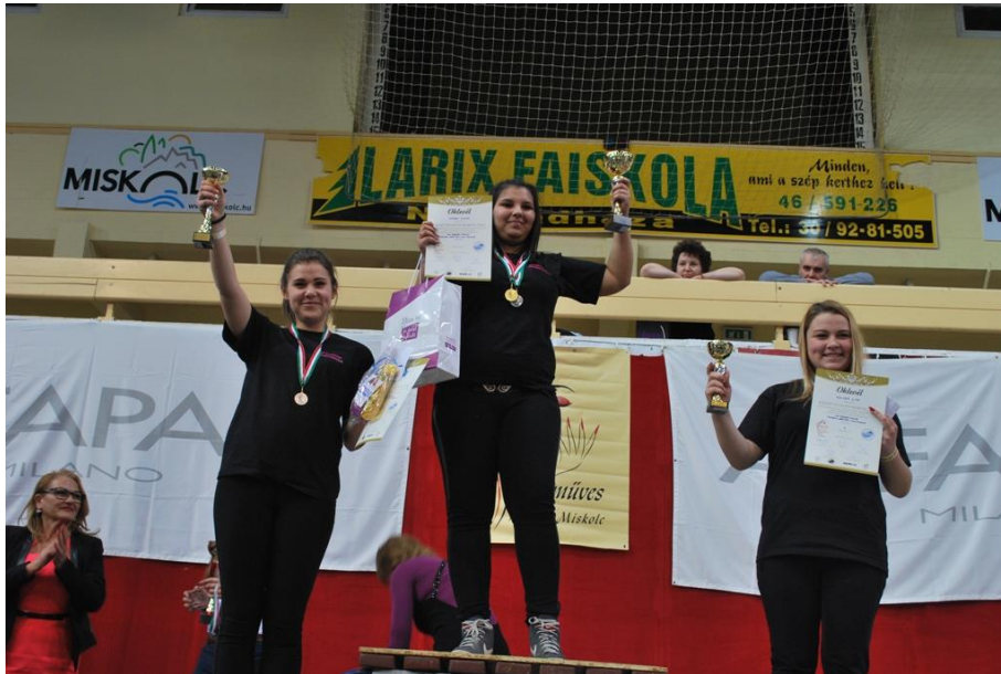
Miskolci Kézműves Kupa 2016. március. Iskolánk három dobogós tanulója