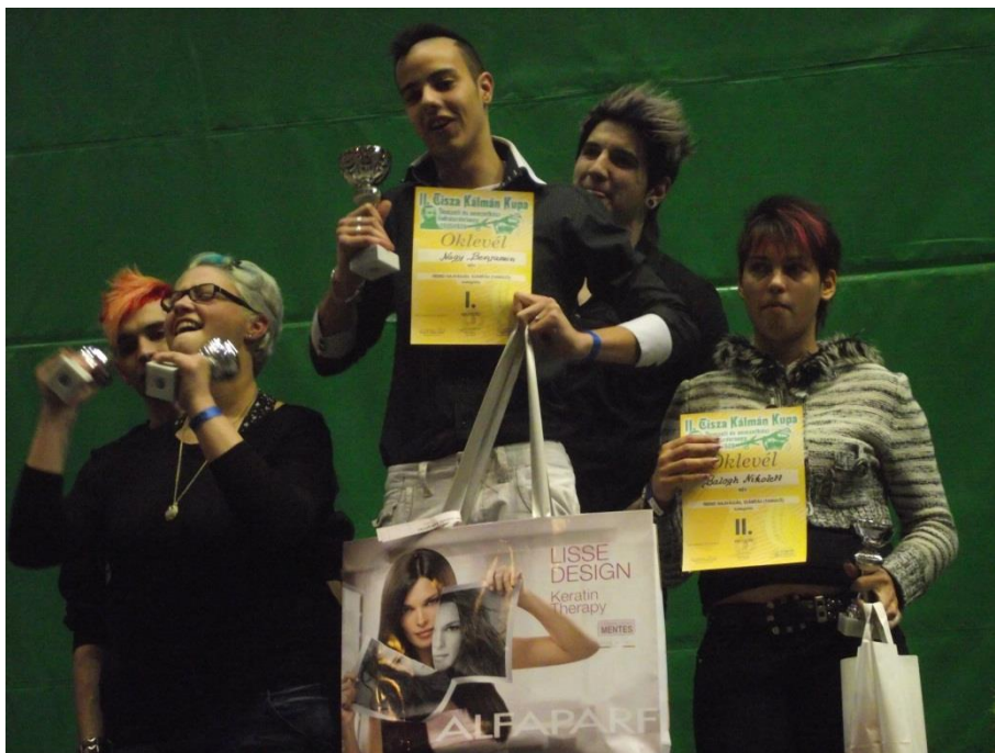
Fodrászverseny Orosháza 2013. január