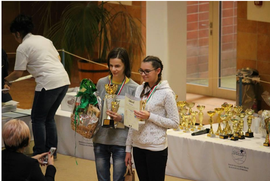
Kézműves Kupa 2019