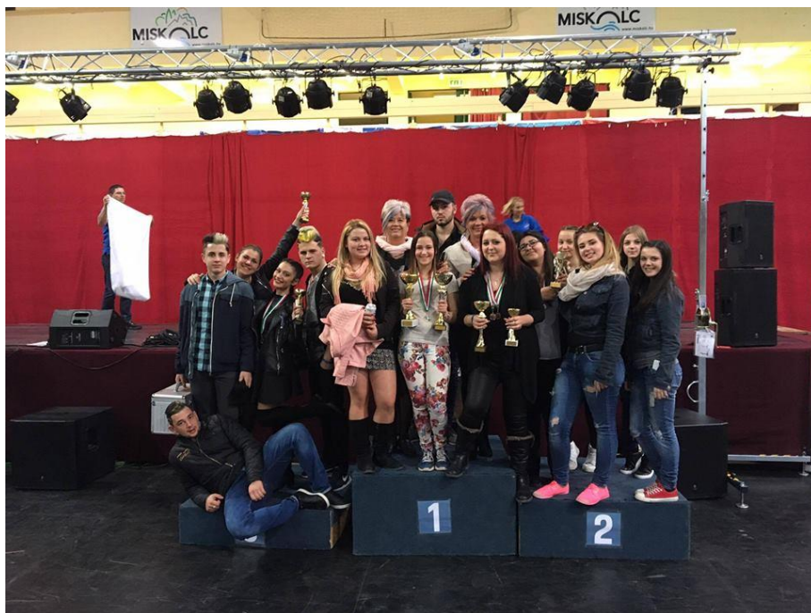
Miskolci Kézműves Kupa 2017