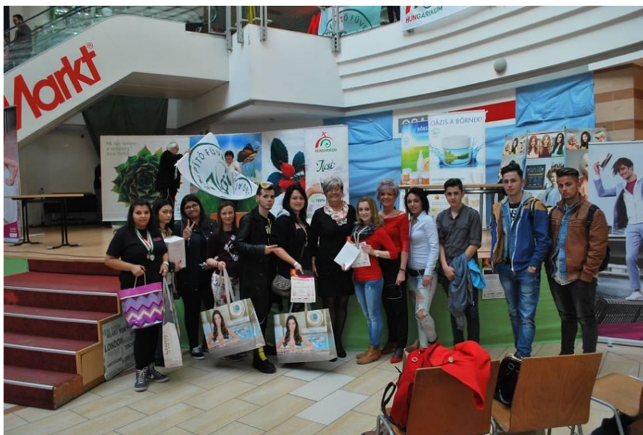
Kós Károly Kupa Békéscsaba 2016. április