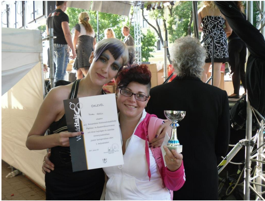
Budapest Magyar Bajnokság 2012