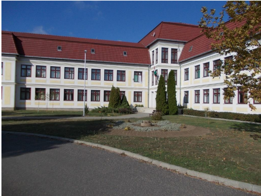
Gyulai Szakképzési Centrum Dévaványai Szakgimnáziuma, Szakközépiskolája és Kollégiuma