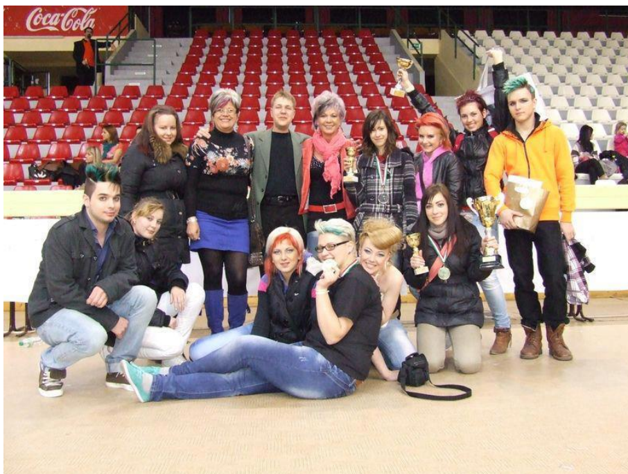
Miskolc 2013. március