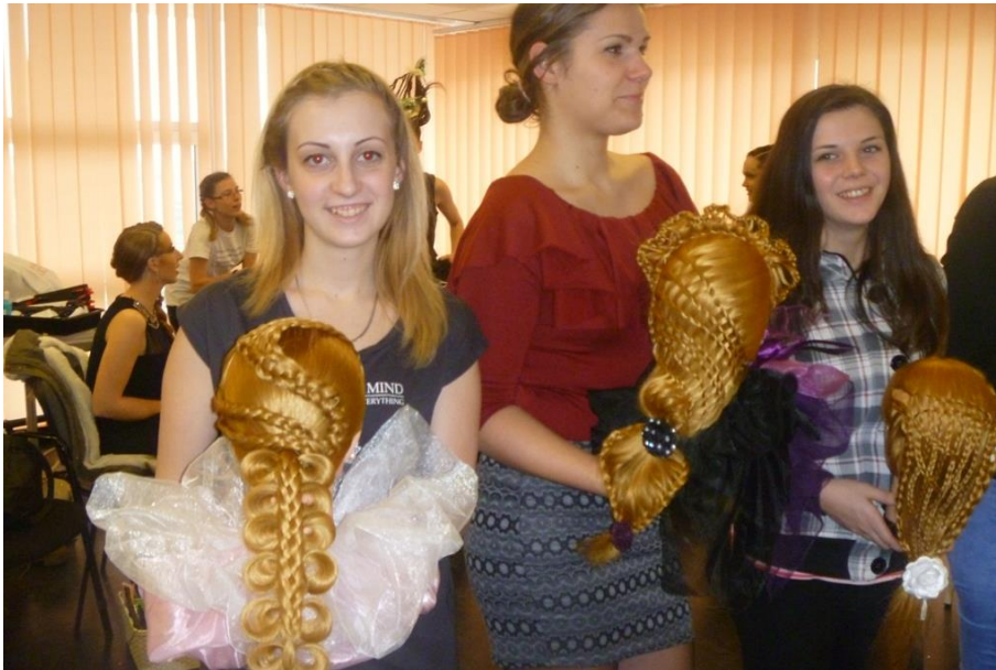
Szabolcs Kupa Nyíregyháza 2017. február