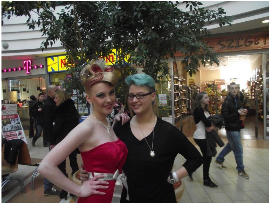
Békéscsaba 2013. március