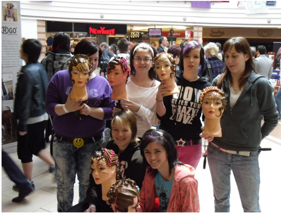
Békéscsabai fodrászverseny 2010. április