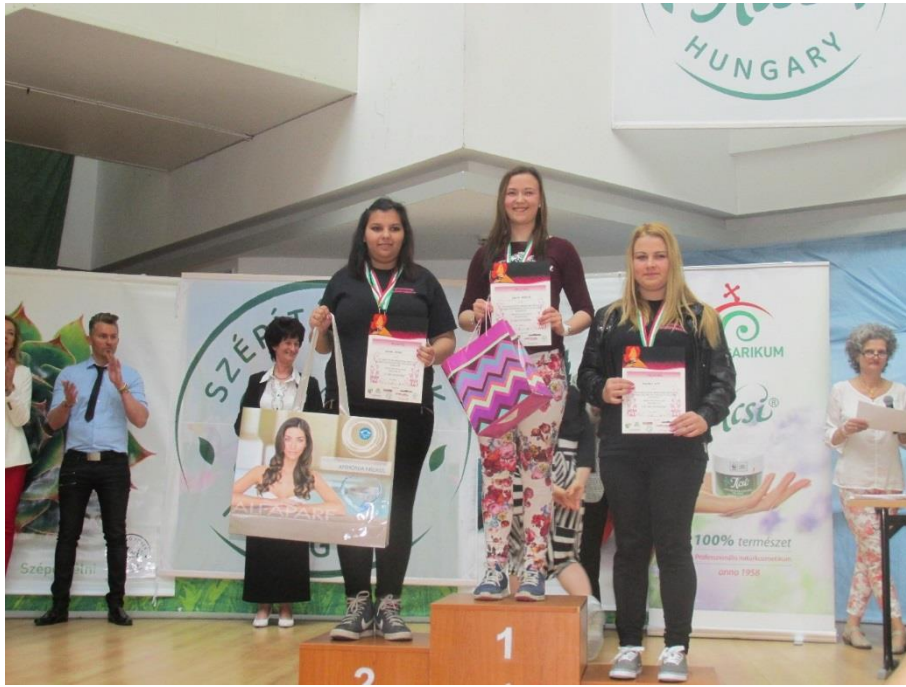
XX. Kós Károly Kupa 2017. április – Iskolánk három dobogósa