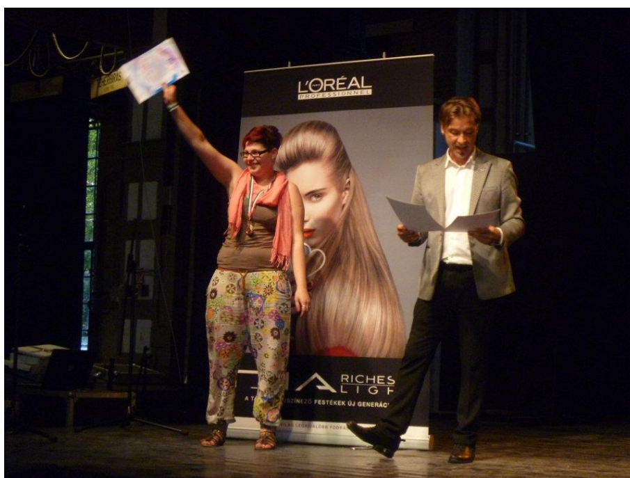
Magyar Bajnok Szarka Natália 2011