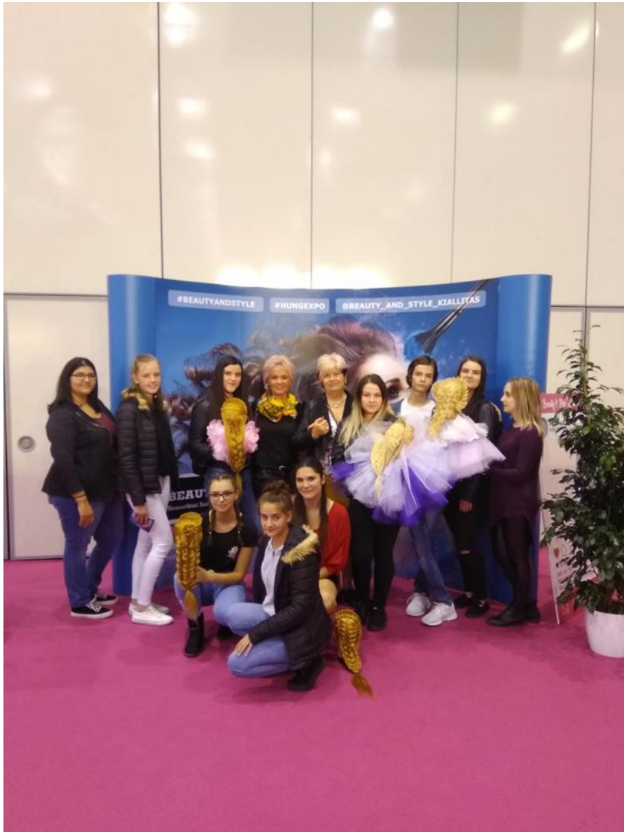
Magyar Bajnokság Budapest 2018. október