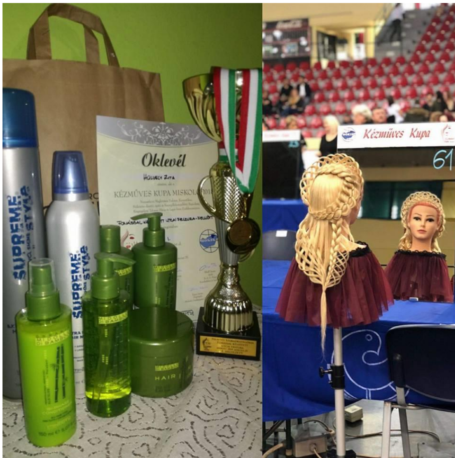
Kézsműves Kupa 2018. 2018. március