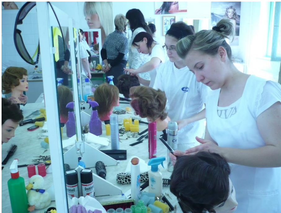
Fodrász szintvizsga 2010