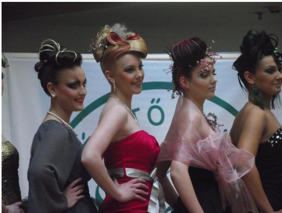
Békéscsaba 2013. március