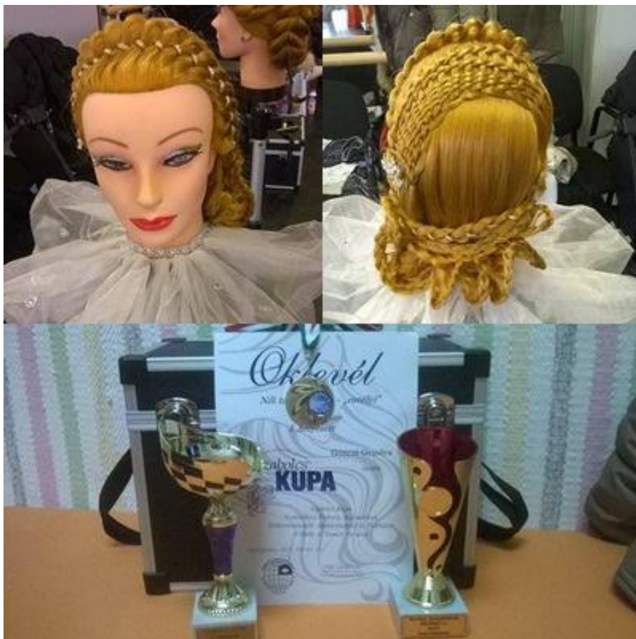
Nyíregyházi Fodrászverseny 2016. február - „Szabolcs Kupa”