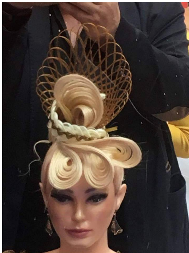
Kós Károly Kupa 2019. Békéscsaba – 2019. március