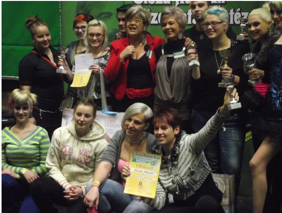
Fodrászverseny Orosháza 2013. január