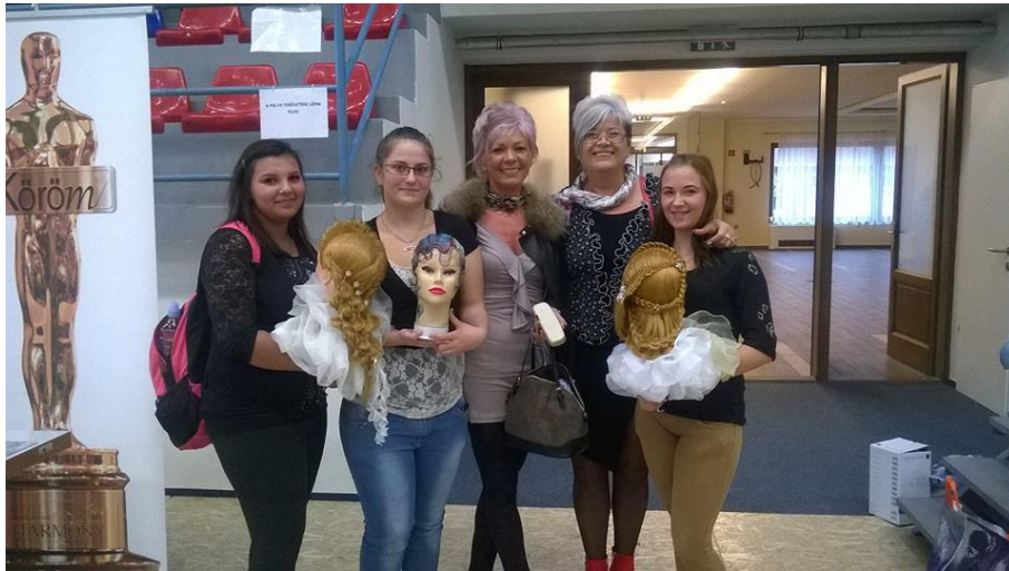
Éremeső a balmazújvárosi fodrászversenyen 2015. október