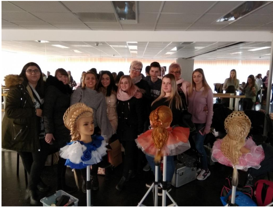
„SZABOLCS KUPA 2018” – 2018. február